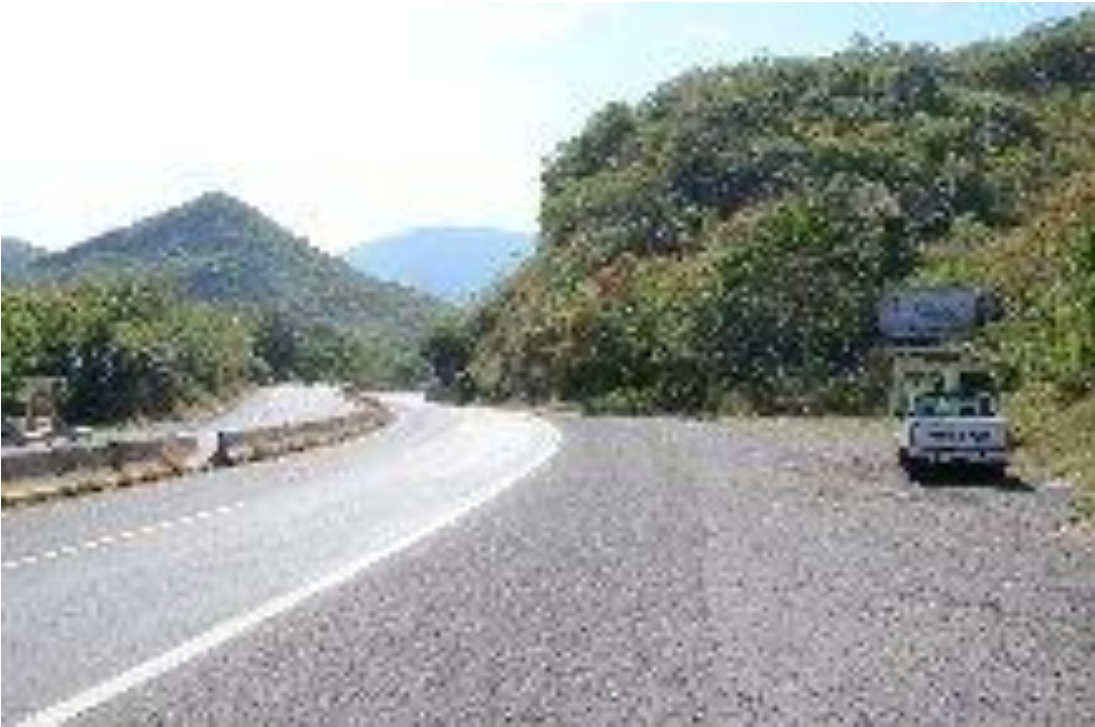
FOTO 2. ESPECTACULAR CARRETERA COLIMA-MANZANILLO