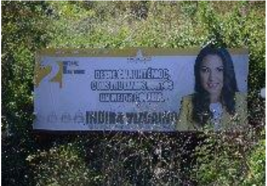
FOTO 3. ESPECTACULAR CARRETERA COLIMA-MANZANILLO

Habiendo dejado establecido el contenido de la propaganda denunciada por el Partido Revolucionario Institucional, es preciso determinar si la misma repercute en el ámbito de la materia electoral, pues para el efecto de declarar fundado o infundado el presente procedimiento especial sancionador, no solo se requiere que se surtan de manera literal lo mandatado de manera general por el octavo párrafo, del artículo 134 de la Constitución Política de los Estados Unidos Mexicanos, sino que el surtimiento de tales extremos de promoción personalizada, tengan además implicación o impacto en el ámbito electoral, tal aseveración encuentra sustento en la Jurisprudencia 2/2011 emitida por la Sala Superior del Tribunal Electoral del Poder Judicial de la Federación que a la letra dice: